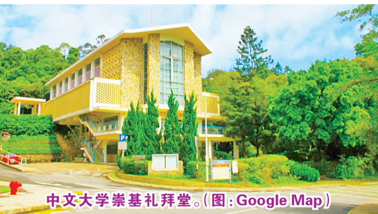
中文大学崇基礼拜堂。

第五波新冠病毒袭港,单日感染个案破千,特首日前公布一系列严防措施,包括宗教场所2月10日起暂停开放。中文大学通告24日起进入校园需出示疫苗记录;礼贤会湾仔堂暂停借出场地,婚礼可进行;圣公会、天主教区籲信徒网上崇拜及弥撒。